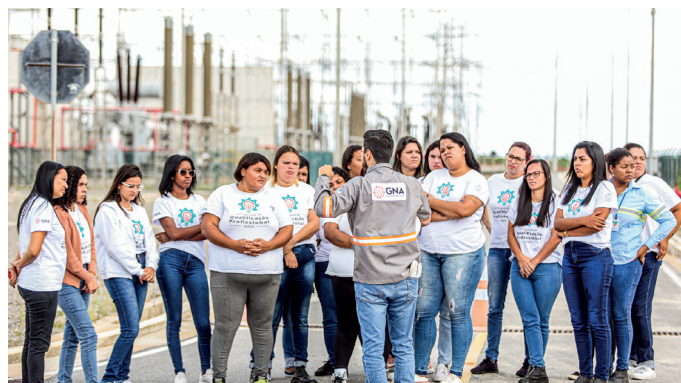
TURMAS 100% FEMININAS DO II PROGRAMA DE QUALIFICAÇÃO VISITAM A GNA

As obras da usina GNA II, que compõe o parque termelétrico a gás natural da GNA (Gás Natural Açú), localizado em São João da Barra, deverão empregar aproximadamente 4 mil profissionais diretos até o final do ano. Parte dessa mão de obra vem sendo formada por alunos do II Programa de Qualificação Profissional oferecido gratuitamente pela companhia à população local. São 11 cursos profissionalizantes nas áreas de construção civil, elétrica, mecânica, logística e metalurgia, além de oficinas de empregabilidade, com dicas de elaboração de currículo e simulação de entrevista. Com objetivo de contribuir para a equidade de gênero no setor, o programa conta com 3 turmas exclusivamente femininas. As aulas são ministradas pela Firjan Senai e pelo Instituto Federal Fluminense (IFF) - campus