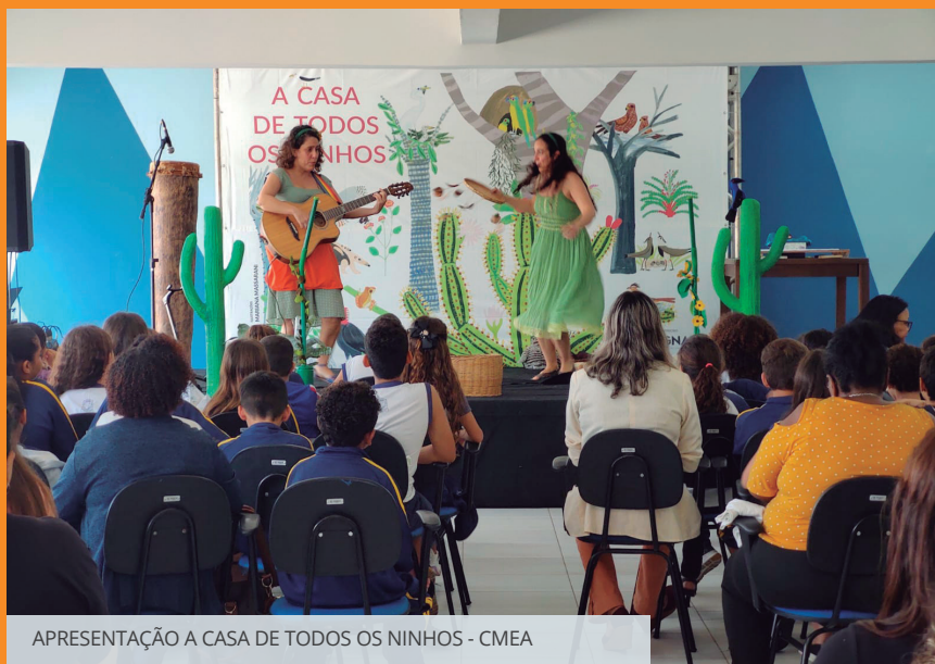
APRESENTAÇÃO A CASA DE TODOS OS NINHOS - CMEA

Lançada em abril deste ano e produzida a partir de dados científicos dos programas de monitoramento da biodiversidade da GNA, a obra literária conta com a