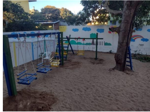
Figura 2: Instalação de Parquinho Infantil com material reciclável no Abrigo Raio de Luz, em São João da Barra, em junho de 2023.

O mês do meio ambiente ainda contou com a entrega de parquinho infantil, feito com madeira reaproveitada, para o Abrigo de Crianças Raio de Luz, de São João da Barra. O pequeno playground foi construído com as madeiras reaproveitadas da obra da UTE GNA II e contou com a parceria dos trabalhadores do Consórcio Geração Açúcar e Siemens Energy. Ao todo, 17 crianças estão sendo beneficiadas pela instalação dos novos brinquedos.