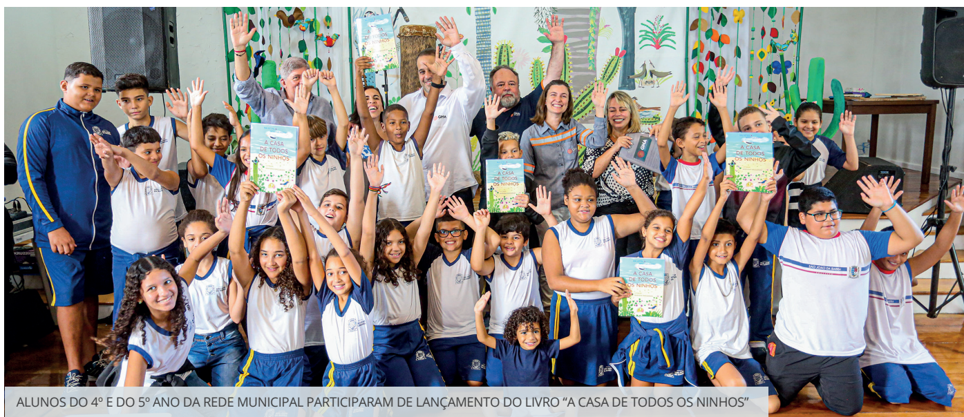
ALUNOS DO 4º E DO 5º ANO DA REDE MUNICIPAL PARTICIPARAM DE LANÇAMENTO DO LIVRO "A CASA DE TODOS OS NINHOS"