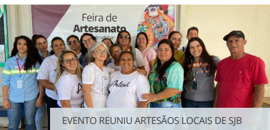
EVENTO REUNIU ARTESÃOS LOCAIS DE SJB