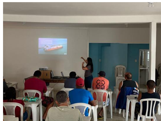
Figura 11: Apresentação da GNA aos novos alunos do curso de qualificação profissional para pescadores, em setembro de 2023.

Adicionalmente, em maio e setembro de 2023, a equipe GNA esteve no curso para pescadores profissionais, o Programa de Orientação Profissional (POP), nas Comunidades de Farol de São Tomé e Atafona, para participar das agendas dos alunos concluintes e ingressantes. O curso POP (Programa de Orientação Profissional) da Marinha do Brasil é destinado aos pescadores profissionais e tem como objetivo orientá-los sobre as normas de segurança da navegação, prevenção de acidentes e preservação do meio ambiente marinho.