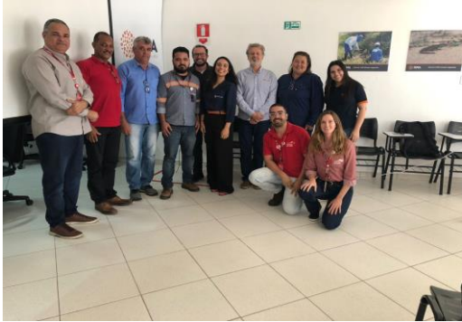
Figura 10: Realização do Fórum da Pesca, com as Colônias Atafona e Farol de São Tomé, em agosto de 2023.

representantes das colônias de pesca de Atafona, Campos dos Goytacazes e Farol de São Tomé no Fórum da Pesca, por meio dos Fóruns de Pesca.