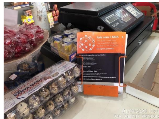
Figura 7: Disponibilização de exemplares do

folheto institucional "Fale com a GNA" em