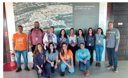
COLABORADORES DO PORTO DO AÇU PASSAM POR SENSIBILIZAÇÃO