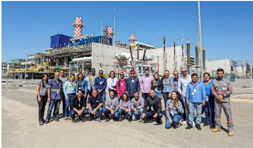
Figura 6: Visita orientada de micro e pequenos empresário ao Complexo Termelétrico Gás Natural Açúcar, em agosto de 2023.

fazem parte do Programa Capacita Fornecedores GNA.