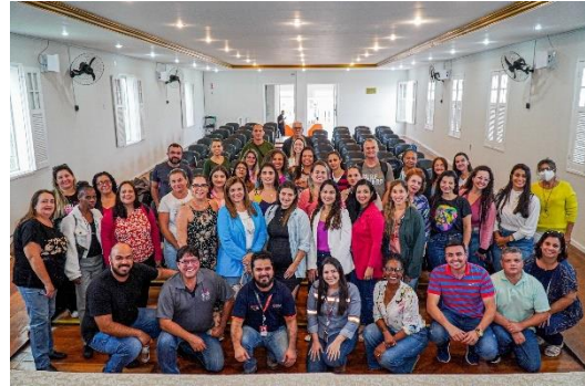
Figura 5: Programa de Prática Educativas reúne os parceiros em São João da Barra, em agosto de 2023.

O Programa de Práticas Educativas Inovadoras faz parte da estratégia de investimento social da GNA, compreendendo uma ação voluntária, e objetiva possibilitar espaços de integração digital, aos professores de São João da Barra, para trocas sobre a didática contemporânea e o compartilhamento de planos de aula em tempo real. No evento, a GNA, com as experiências recentes do Programa de Educação Ambiental, falou sobre a perspectiva do setor privado em relação a práticas inovadoras de educação para o desenvolvimento local.