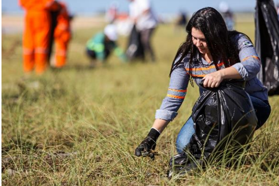
Figura 1: Mutirão de Limpeza na Praia em ação de voluntariado no mês de junho de 2023.

passou por triagem e teve a sua destinação adaptada conforme o perfil de cada item.