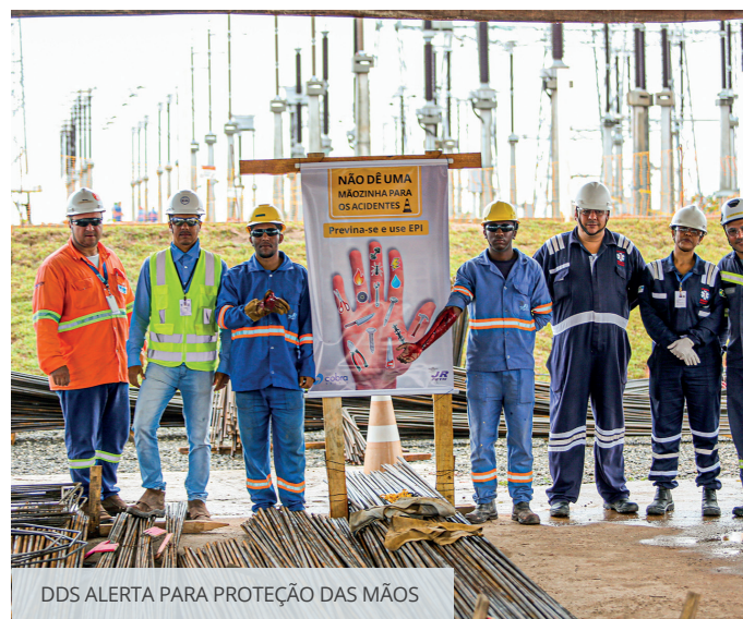
DDS ALERTA PARA PROTEÇÃO DAS MÃOS

“As mãos são a parte do nosso corpo mais afetada por acidentes por conta do alto grau de exposição. Esse ano, para ajudar nesse esforço de conscientização quanto às medidas preventivas, convocamos as