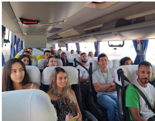
Figura 9: Visita de alunos do Instituto Federal Fluminense ao Complexo Termelétrico GNA, em novembro de 2023.

Em novembro de 2023 , os alunos dos cursos de Engenharia Eletromecânica e Engenharia Ambiental do Instituto Federal Fluminense tiveram a oportunidade de conhecer a rotina do Complexo Termelétrico GNA. Além de receberem explicações sobre as questões operacionais do ativo, também presenciaram agendas ambientais com rodas de conversa sobre os possíveis impactos da atividade de geração de energia sobre o meio ambiente e de qual forma o empreendedor assume compromissos para redução e/ou compensação desses efeitos.