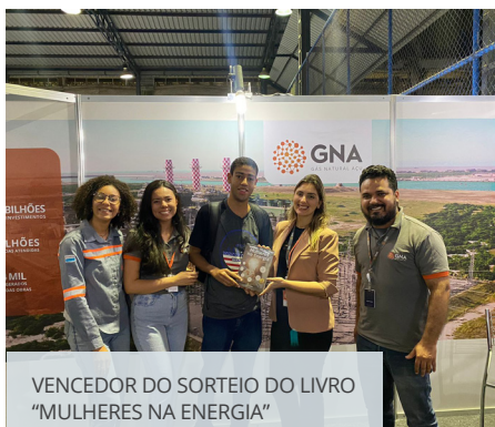
VENCEDOR DO SORTEIO DO LIVRO “MULHERES NA ENERGIA”

A GNA marcou presença na 9ª Mostra Tecnológica para Estágio e Emprego (Mostre-se), realizada pelo IFF Campos, nos dias 30 e 31/08. Estudantes e profissionais da região puderam conhecer mais sobre a construção do maior parque termelétrico a gás natural da América Latina e as oportunidades que o projeto está trazendo para toda a região. Quem passou pelo estande da empresa participou de sorteio de exemplares do livro “Mulheres na Energia”, patrocinado pela GNA em 2022, e conversou com colaboradores e estagiários sobre a experiência de trabalhar na GNA.