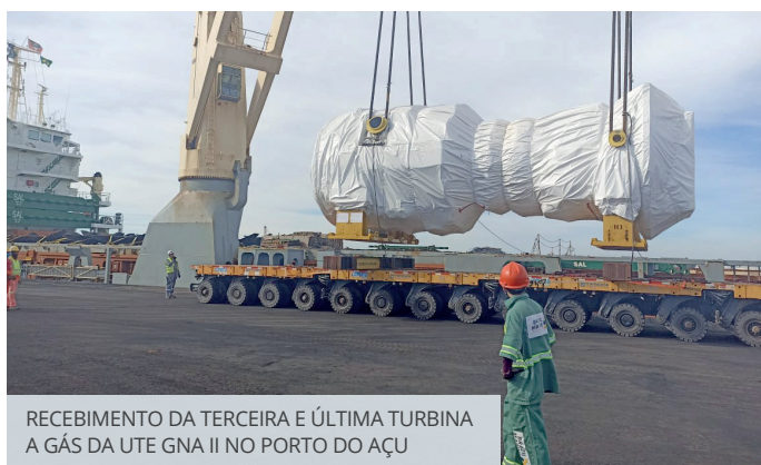
RECEBIMENTO DA TERCEIRA E ÚLTIMA TURBINA A GÁS DA UTE GNA II NO PORTO DO AÇU

Como parte do movimento “Maio Amarelo”, a iniciativa foi realizada em parceria entre o Programa Laço Amarelo e as empresas PdA, GNA, Vast e Ferroport. Ao longo do mês foram realizadas blitzes educativas, além de ações de conscientização com a comunidade escolar de Campos e São João da Barra. Placas e outdoors instalados ao longo das principais vias do Porto do Açu reforçaram a relação direta entre o desrespeito à legislação do trânsito e suas graves consequências.