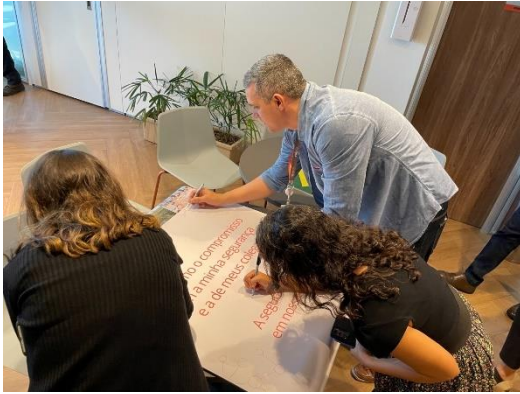
Figura 3: Ação interna em alusão ao Dia Nacional de Prevenção de Acidentes de Trabalho, em julho de 2023.

Em agosto de 2023 , a GNA promoveu a apresentação teatral infanto juvenil intitulada “A Casa de Todos os Ninhos”, no Centro Municipal de Educação Avançado (CMEA), em parceria com a comunidade escolar de Mato Escuro. A peça é inspirada em livro patrocinado pela GNA com o mesmo título e compõe o Programa Restinga em Prosa, lançado pela empresa em abril de 2023.