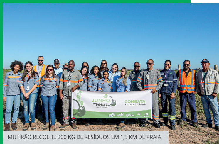
MUTIRÃO RECOLHE 200 KG DE RESÍDUOS EM 1,5 KM DE PRAIA

Para aproximar o time de colaboradores e parceiros das práticas da empresa em prol da Sustentabilidade, a GNA reuniu todos numa ação educativa no dia 7/6: foi feito um grande mutirão de limpeza da areia da praia onde está localizado o Terminal de Regaseificação. Em quase 1,5 km percorridos, foram recolhidos 200 kg de resíduos no mutirão Praia Limpa.