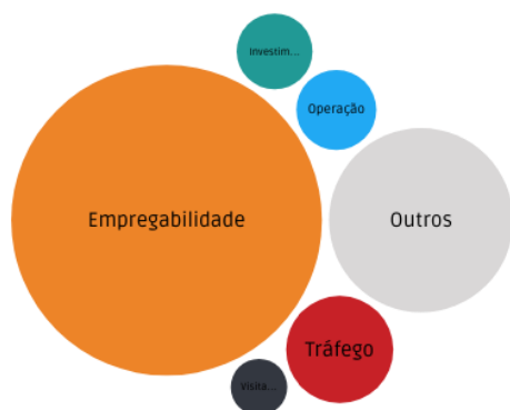
Figura 13: Categorização das manifestações por temas.

O fluxo estabelecido pelo Mecanismo de Queixas e Reclamações – normativo interno orienta e dá as diretrizes para a gestão deste canal de comunicação. Ele estabelece que as manifestações de baixa criticidade devam ser respondidas em até 10 dias.