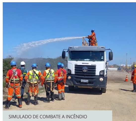
SIMULADO DE COMBATE A INCÊNDIO

Em agosto, a Brigada de Incêndio da companhia participou de mais um simulado, desta vez organizado pelo Consórcio Geração Açu (CGA). O exercício simulou um incêndio em vegetação próximo à área da