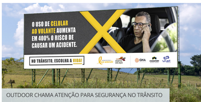
OUTDOOR CHAMA ATENÇÃO PARA SEGURANÇA NO TRÂNSITO