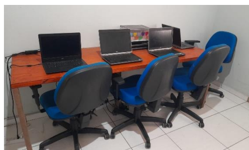
Figura 8: Doação de cadeiras à ONG Semente do Amor, de São João de Barra, em outubro de 2023.

Por fim, em complemento à doação de computadores realizada em junho de 2023, a ONG Sementes do Amor também recebeu, em outubro, a doação de cadeiras de escritório para compor a mobília da sala de informática da instituição. As cadeiras faziam parte do acervo patrimonial da GNA e a doação corroborou para o reaproveitamento das mobílias e redução da geração de novos resíduos no âmbito da obra. Cabe destacar que a GNA já havia feito a doação de 10 notebooks à ONG, contribuindo para as atividades de formação de jovens promovida pela instituição.