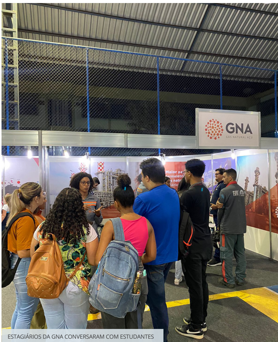
ESTAGIÁRIOS DA GNA CONVERSARAM COM ESTUDANTES