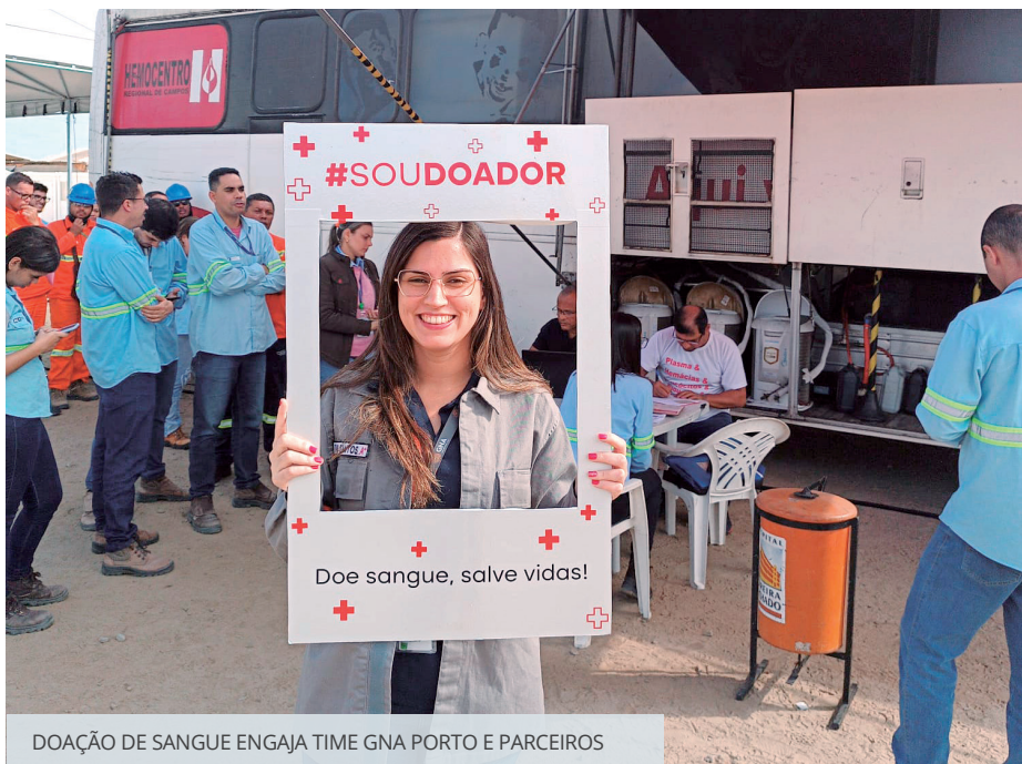
DOAÇÃO DE SANGUE ENGAJA TIME GNA PORTO E PARCEIROS

Quarenta e duas bolsas de sangue foram coletadas entre 9h e 15h no ônibus do hemocentro de Campos que foi disponibilizado na área de convivência do canteiro de obras do Consórcio Geração Açu (CGA). A ação é mais uma forma de praticar um dos principais valores da GNA: o cuidado com as pessoas. Agradecemos a todos que participaram desse ato de amor à vida!