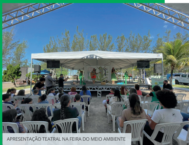
APRESENTAÇÃO TEATRAL NA FEIRA DO MEIO AMBIENTE

No dia 6/6, a GNA marcou presença na Feira do Meio Ambiente, realizada pela prefeitura de São João da Barra, no Espaço da Ciência, em Atafona. No estande, centenas de alunos da rede municipal de ensino e educadores conheceram as iniciativas da companhia para a proteção da fauna e da flora local. Quem estava no evento também pôde assistir ao espetáculo teatral inspirado no livro “A Casa de Todos os Ninhos”, em duas sessões exclusivas, como parte do projeto Restinga em Prosa, lançado pela GNA em abril.