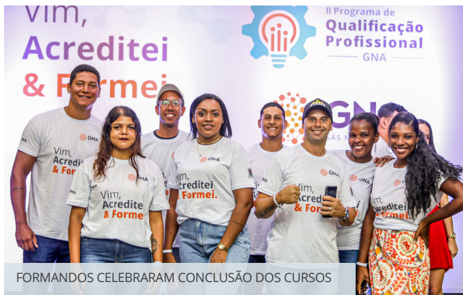
FORMANDOS CELEBRARAM CONCLUSÃO DOS CURSOS