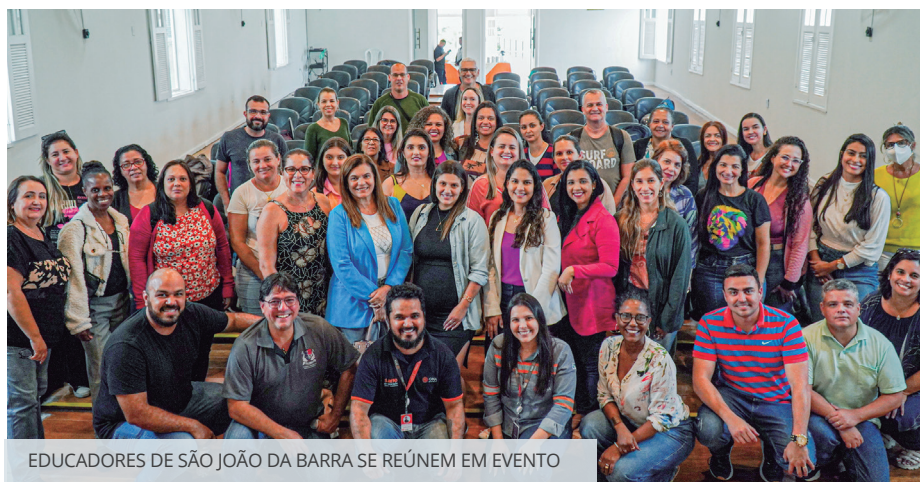
EDUCADORES DE SÃO JOÃO DA BARRA SE REÚNEM EM EVENTO

capacitar educadores para a adoção de métodos inovadores na abordagem de conteúdos em sala de aula visando à melhoria no ensino e na aprendizagem. A primeira etapa do programa consistiu no desenvolvimento, pelo IFF, de uma plataforma com diversos conteúdos, que, agora, será compartilhada com os educadores. A iniciativa beneficiará cerca de 1.200 alunos, além de 120 professores e coordenadores.